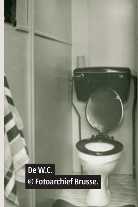
De W.C.

De vergunning is begin 1964 nog niet rond, maar zal worden verstrekt voor 10 jaar. Het gaat tenslotte om tijdelijke huisvesting. De bewoners tekenen een contract waarbij zij worden verplicht de