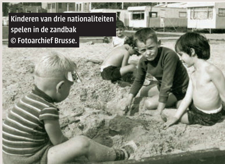
Kinderen van drie nationaliteiten spelen in de zandbak © Fotoarchief Brusse.

De gezamenlijke Twentse fabrikanten komen met een oplossing.