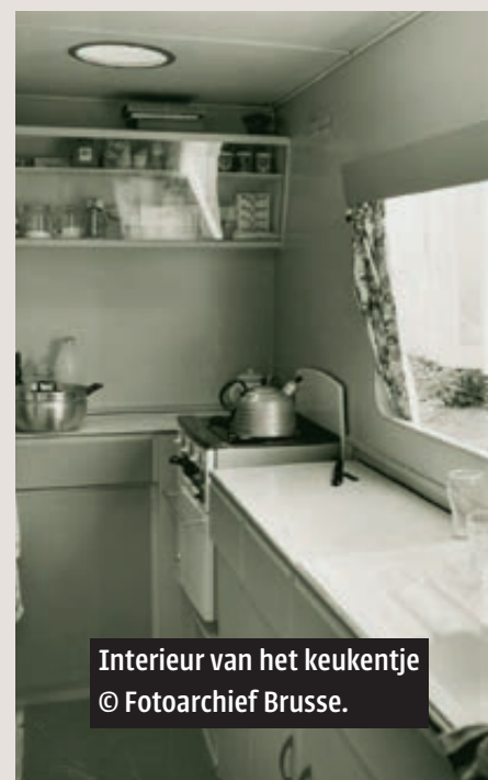
Interieur van het keukentje © Fotoarchief Brusse.

bungalow te verlaten, zodra een normale woning beschikbaar komt. Men gaat er ook nog steeds van uit dat de werknemers op termijn terugkeren naar hun thuisland. Uit een rapport in 1971 blijkt dat de gemiddelde verblijfsduur van Italianen 5,7 jaar bedraagt, van Spanjaarden 3,7 jaar, Turken en Marokkanen slechts 2,5 jaar. Het idee van het 'bungalowparkje'