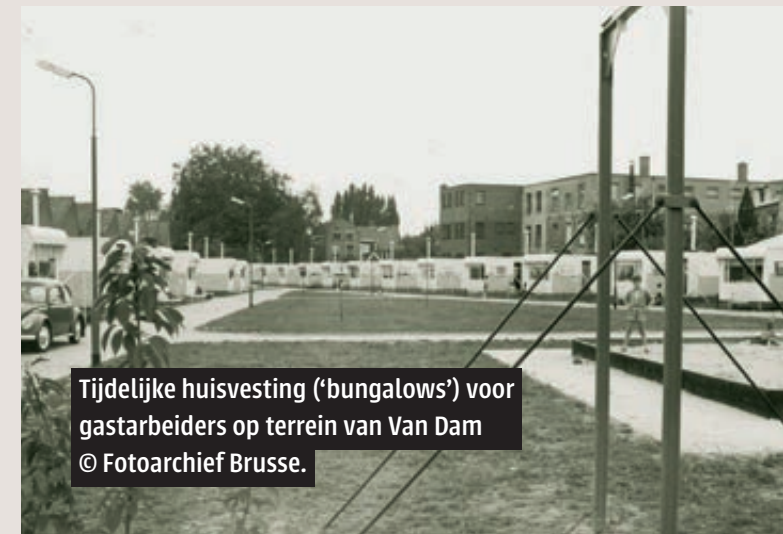
Tijdelijke huisvesting ('bungalows') voor gastarbeiders op terrein van Van Dam © Fotoarchief Brusse.

bungalow te verlaten, zodra een normale woning beschikbaar komt. Men gaat er ook nog steeds van uit dat de werknemers op termijn terugkeren naar hun thuisland. Uit een rapport in 1971 blijkt dat de gemiddelde verblijfsduur van Italianen 5,7 jaar bedraagt, van Spanjaarden 3,7 jaar, Turken en Marokkanen slechts 2,5 jaar. Het idee van het 'bungalowparkje'