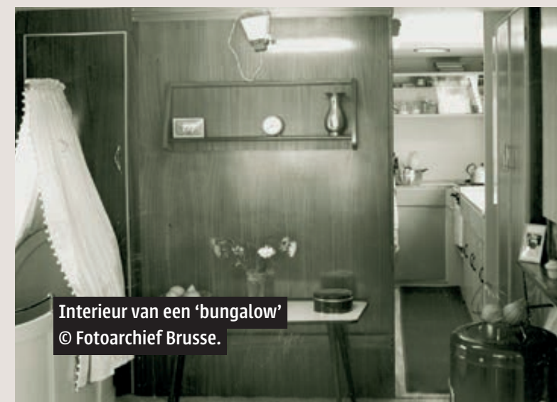
Interieur van een 'bungalow' © Fotoarchief Brusse.

is in die tijd uniek in Nederland. In een brochure uit 1966 van de Commissie Buitenlandse Werknemers van de drie landelijke werkgeversverenigingen (sociaal, katholiek en protestants) wordt het project, dan wel weer 'caravan-project' genoemd, speciaal aangeprezen, juist vanwege het tijdelijke karakter. Want door de toepassing van mobiele bungalows wordt "het gevaar van de zo beruchte semipermanente oplossingen, die meestal de neiging hebben zichzelf te overleven, in veel mindere mate aanwezig is". Hiermee wordt verwezen naar woonoorden met houten barakken die ook