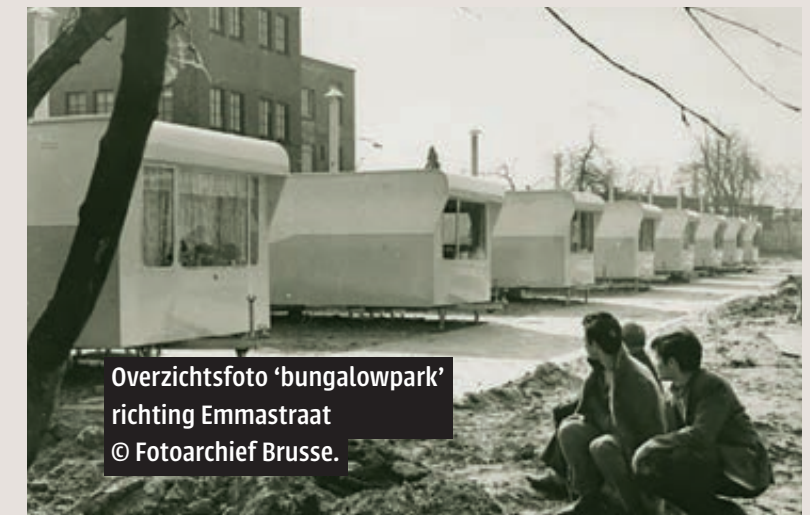
Overzichtsfoto 'bungalowpark' richting Emmastraat

land, dat dit niet meer via natuurlijk verloop kon worden aangevuld. Daarom sprong de overheid in. Via wervingsverdragen met onder andere Italië (1949), Spanje (1961), Turkije (1964), Griekenland (1966) en Marokko (1969) werden buitenlandse arbeiders door hun toekomstige werkgevers